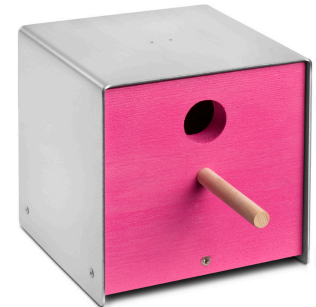
06 3107 twitter.pink edelstahl, lackiertes holz, pink