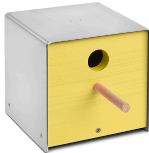
06 3105 twitter. yellow edelstahl, lackiertes holz, gelb