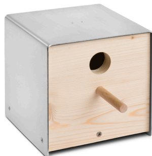
06 3102 twitter.nature edelstahl, unbehandeltes holz