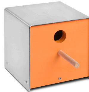
06 3106 twitter. orange edelstahl, lackiertes holz, orange