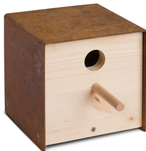
06 3101 twitter.iron corten-stahl, unbehandeltes holz