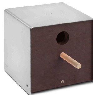
06 3103 twitter. brown edelstahl, lackiertes holz, braun

material: edelstahlblech bzw. corten-stahl, 1,5 mm dick, dreischichtplatte.